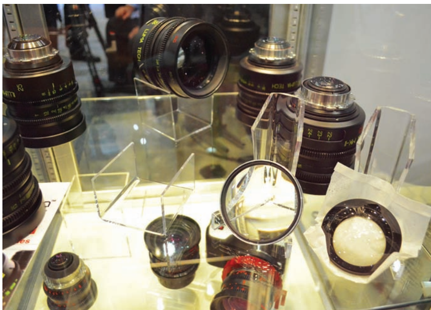
Объективы ILLUMINA и оптические элементы для них

зиться, ценности объектива с течением времени. Данная оптика отвечает этому требованию. На первый взгляд, конструкция этих объективов не самая современная. Но в этом и заключается ее достоинство. Потому что объективы, выпущенные несколько лет назад, можно без труда модернизировать, просто заменив некоторые оптические элементы. И продолжать эксплуатировать оптику.